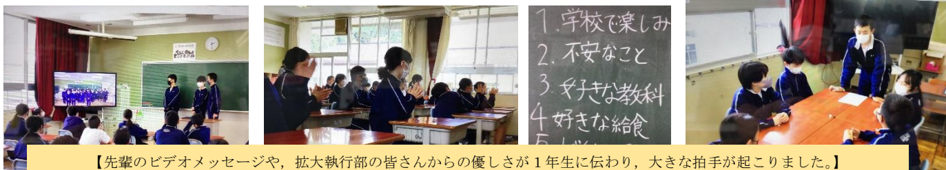
【先輩のビデオメッセージや、拡大執行部の皆さんからの優しさが1年生に伝わり、大きな拍手が起こりました。】

3年生の素敵な姿を見た1年生は、これからも頑張りたいと振り返りの場で話をしていました。入学後、1カ月が過ぎました。成長を感じる振り返りの姿でした。