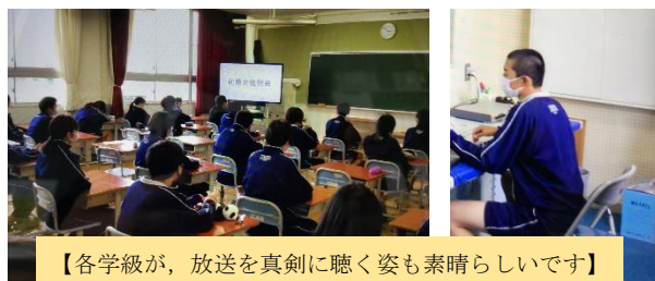
【各学級が、放送を真剣に聴く姿も素晴らしいです】

これから、仲間と共に踏み出す一歩が、どのような新しい風を起こすのかを楽しみにしていきましょう。