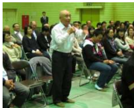
《講演後、地域の方からの感想》

はいという素直な心 ありがとうという感謝の心 私がしますという奉仕の心 すみませんという反省の心 おかげさまという謙虚な心