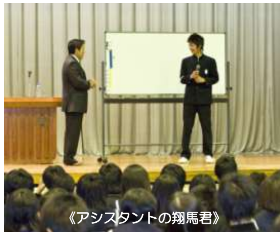
《アシスタントの翔馬君》

柔道の創始者嘉納治五郎先生が伝えた言葉「精力善用」「自他共栄」(自分のエネルギーを良い行いに使いなさい。そうすれば自分も他人もみんな栄える)が古賀塾の教えです。