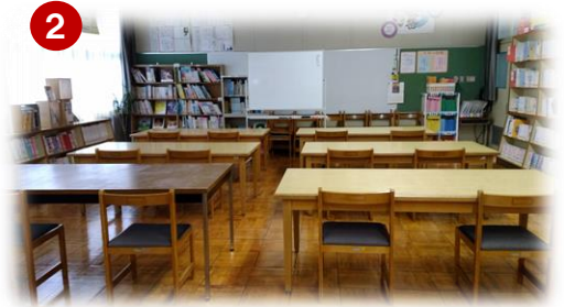
② 椅子の数を減らした配置