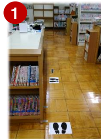
① 貸出・返却手続きに並ぶ時の位置を示す足型

子どもたちが利用しやすくなるように、本棚の配置を換え、カウンター前が混み合わないよう、貸出・返却の仕方を変更しました。そこで、どの学年も改めて、図書室利用の仕方を学びました。図書室利用の前には、「図書室を利用するみんなのために手を洗う」、利用後は「自分のために手を洗う」という、新しい生活様式も学びました。