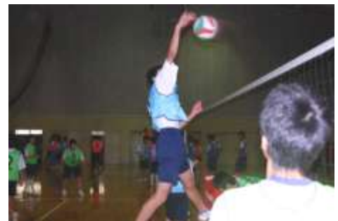
《3年生バレーボールの授業》

10月28日には、1年生の社会科で全校研究授業をおこないました。「岩のように小さな沖ノ鳥島を大金をかけて守る」意味を資料を使って考えました。どの生徒も、資料を読み取り、国土の面や資源の面から自分の考えをきちんと書いていました。