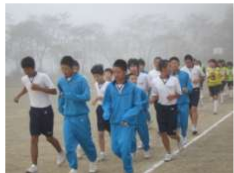
《秋の朝の風物、朝霧の中での練習》

男子Aチームは、並んでゴール前の走路に入ってきましたが、折り返しのコーンでスピードを落とさざるをえなくて、最後は胸の差で4位になりました。競技としては、走路を間違っただけで残念ながら記録なしということになりましたが、実力は堂々とした4位（胸の差を考えれば3位と言ってもいいくらい）です。男子Bチーム、女子Aチーム、Bチームも全力で走り、それぞれの力を出した大会でした。この力は美濃市の駅伝につながるはずで