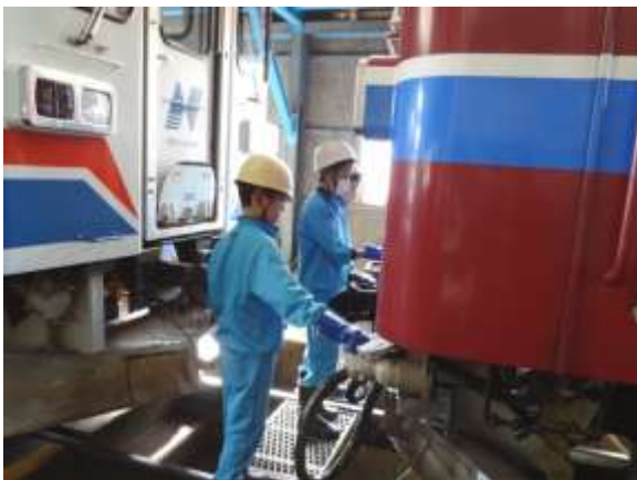
《列車のメンテナンス》