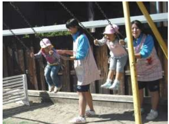
《保育園で園児と遊ぶ》