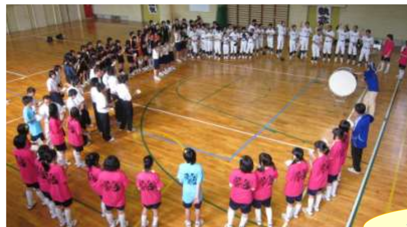
全校生徒で士気高揚