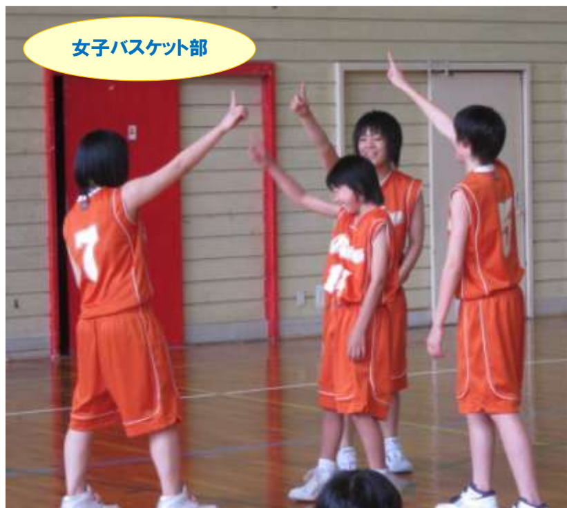
女子バスケット部