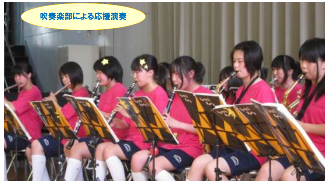
吹奏楽部による応援演奏